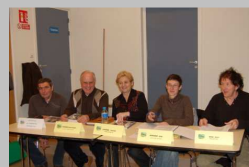
AG de l'USAH

L'USAH et l'ABSA ont organisé leurs traditionnelles assemblées générales respectivement les 22 et 28 janvier dernier. A noter que l'AG du CDSA 01 se déroulera le 8 avril à Bourg-en-Bresse.